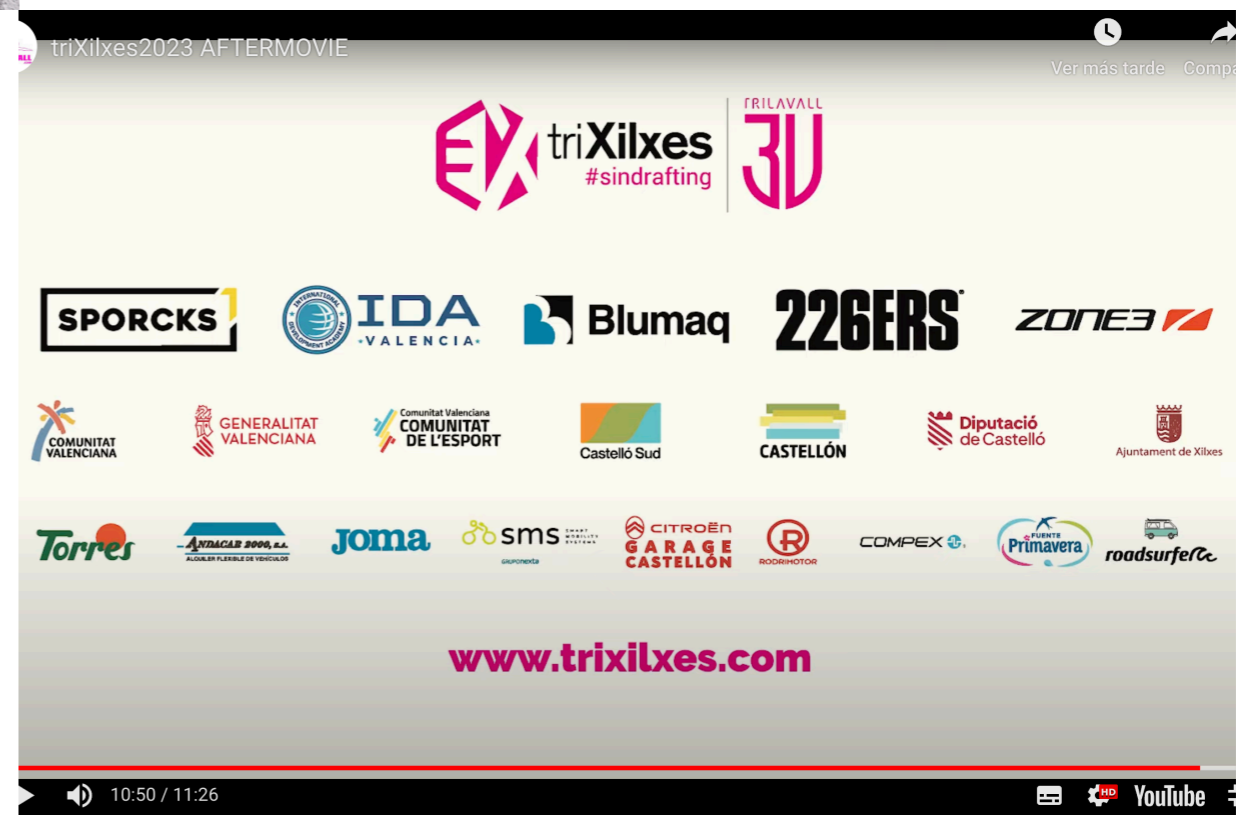
PATROCINADORES AL FINAL DEL VIDEO