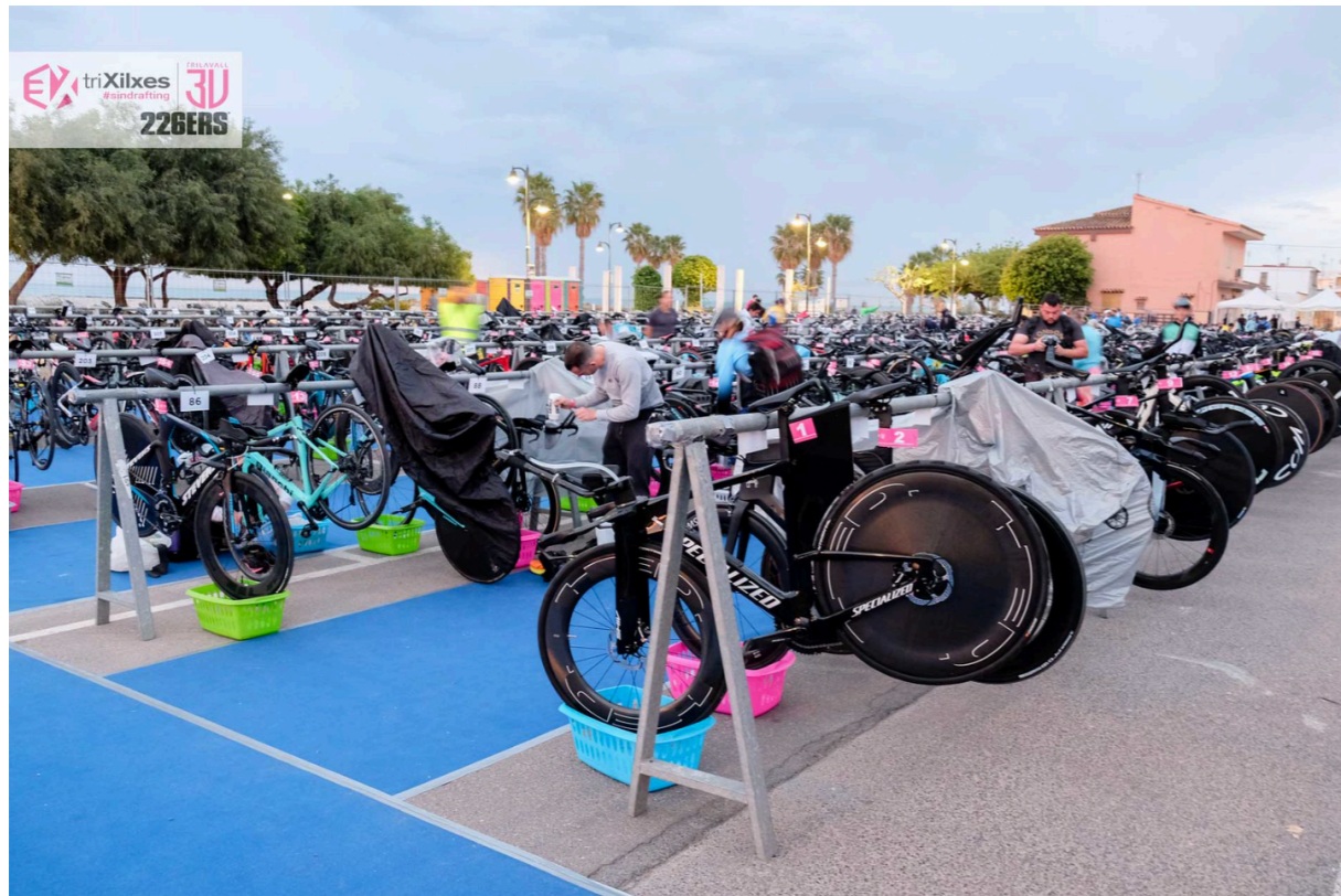
MOSCA EN FOTOS OFICIALES