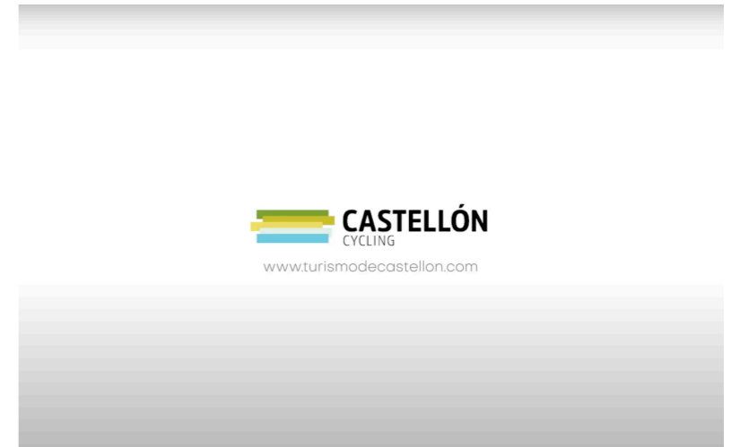
SPOT 20 O 30 SEGUNDOS