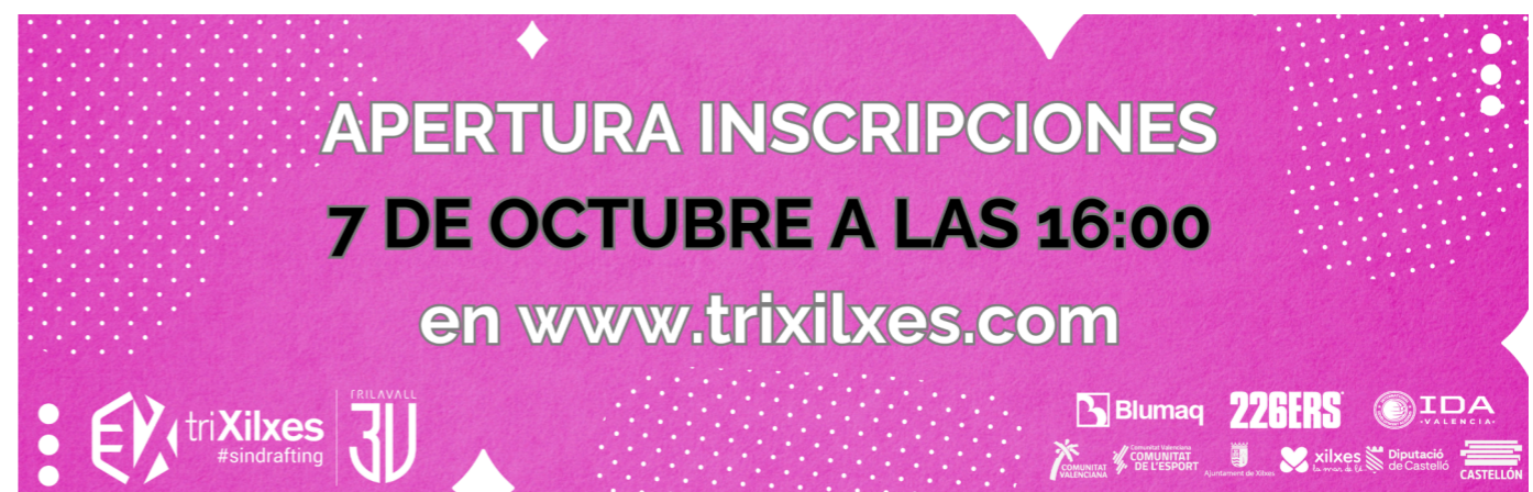
PORTADA DE FACEBOOK