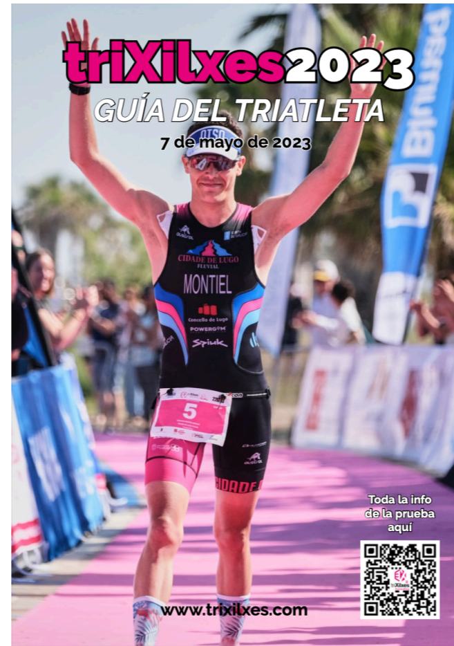
GUIA DIGITAL DEL EVENTO