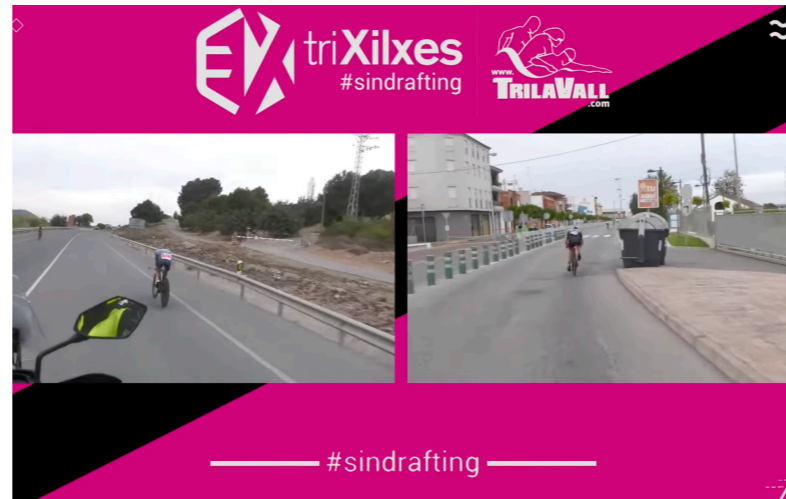
CREATIVIDAD DE VARIAS PANTALLAS